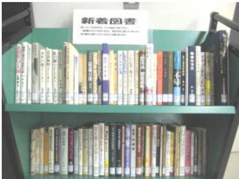
青丘文庫 新着図書の棚 2091.11 / 書名は読めませんね……