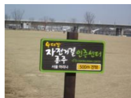
(広いサイクリングロード、自転車センターの掲示)