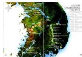
(パスポートです。まさに4大河川です。)