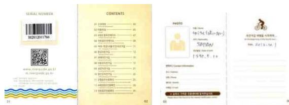
(最初の頁にバーコードを貼ってもらいます。)