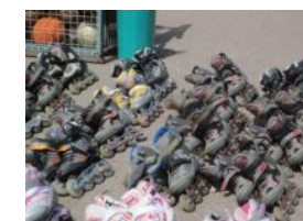
(インラインスケート、たくさんあります)

ロッカーの鍵も無料でかしてくれた。自転車のチェーン式鍵 も頼んだら貸してくれた(持参するようにと紹介するブログも あったが・・・。)