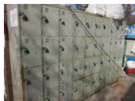
(借りた MTB とロッカー)