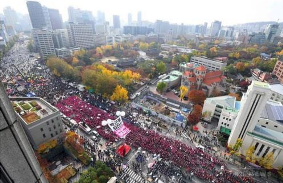
韓国・ソウル中心部で行われた朴槿恵（パク・クネ）大統領の辞任を求めるデモの様子（2016 年 11 月 12 日撮影）。